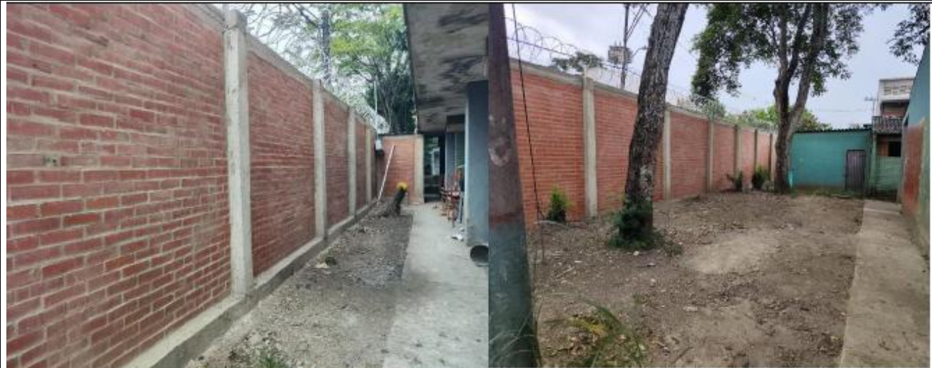
MURO LADRILLO SOGA LIMPIO CONCERTINA REVITADO